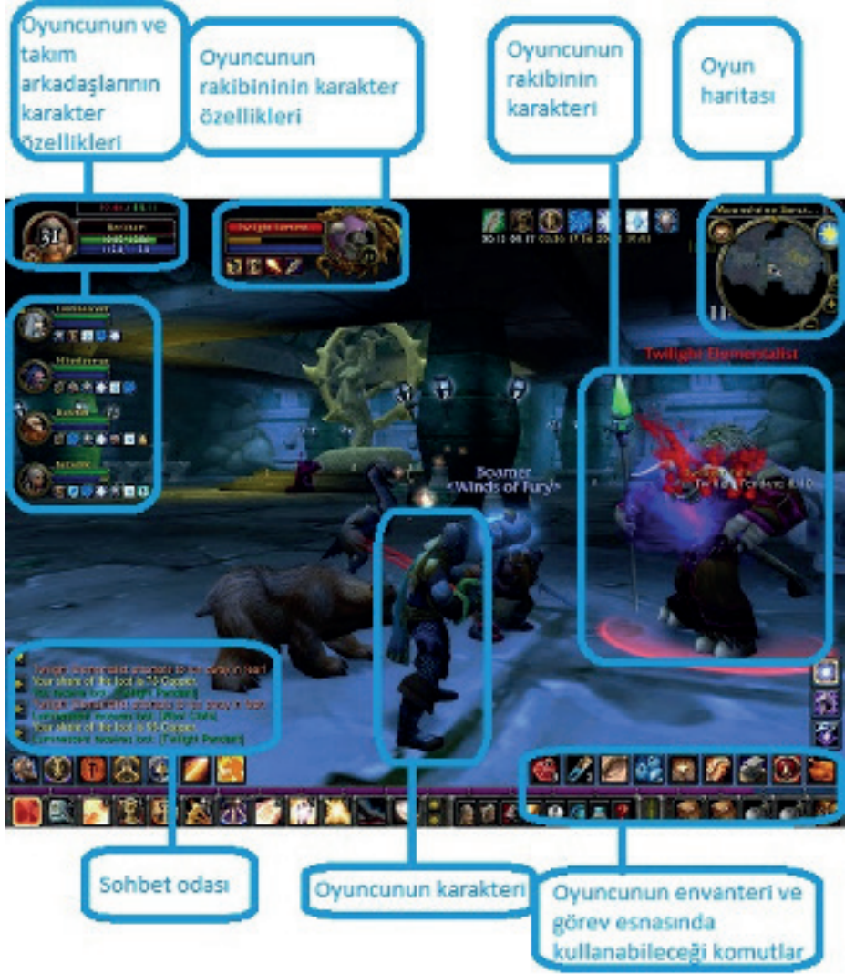
Şekil 1. Bir MMORPG olan World of Warcraft 'tan bir ekran görüntüsü.

MMORPG'ye Türkiye'de de popüler olan World of Warcraft , Knigh Online , Metin 2 ve Black Desert Online örnek verilebilir (bkz. Şekil 1).